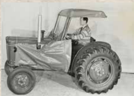
Førervern: Den tidligste utgaven av Duunbøylene kunne leveres med duktak. Merk vintertrekket på motoren, som ledet varmluft bakover.

på Duuns bilhengere er i ettertid stemplet som legendarisk.