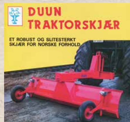
Revolusjon: Duunskjæret representerte nye tider, både for brukeren og bedriften.