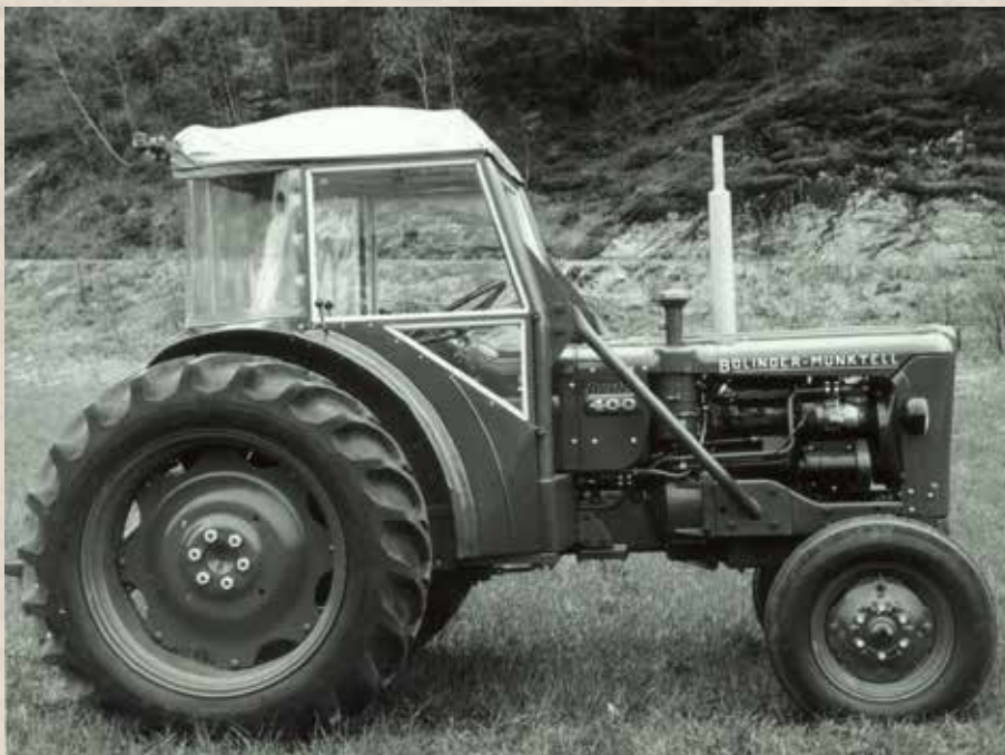
Vinterklar: Helinnkledd Duunbøyle for BM 400 Buster. Denne traktormodellen ble viktig i 1960-årene.