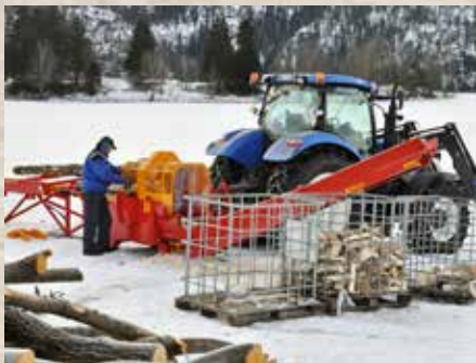
Satser på ved: Bedriften tilbyr i dag det bredeste programmet av norskproduserte vedmaskiner.

A-K gjerne ville selge Duuns pumper, som beholdt sin markedsandel. Avtalen ble begynnelsen på det som har blitt til et langvarig og fruktbart samarbeid med A-K.