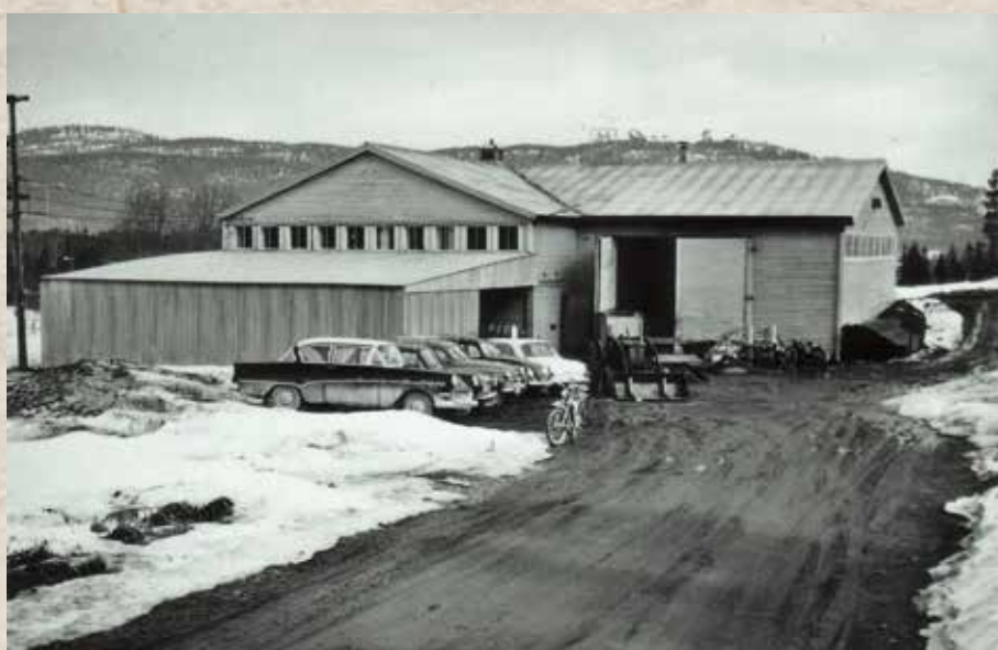
Tryggvang: Duun-Smia holdt til i disse lokalene i tolv år. Her ble Duunbøylen født.

TEKST: Reidar Heieren, redaksjon@traktor.no