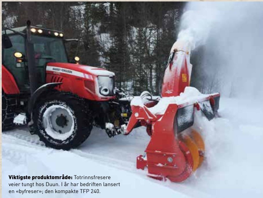
Viktigste produktområde: Totrinnsfresere veier tungt hos Duun. I år har bedriften lansert en «byfreser»; den kompakte TFP 240.

Det var flere grunner til at bedriften var rigget for å gå inn i nye produktområder. En av de viktigste var forbindelsen til A-K, som var interessert i et bredere samarbeid. Resultatene kom som perler på ei snor. I 2002 lanserte Duun sin aller første snøfreser, først V-fresere og siden totrinnsfresere. Ballen rullet videre. I 2005 kom bedriften med den hydrauliske vedmaskina VM 100, som ble starten på et bredt