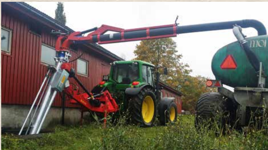
Gjødselpumper: Duun kom sent, men godt. Siden introduksjonen i 1991 har Duun-pumpene vært markedsleder i Norge.