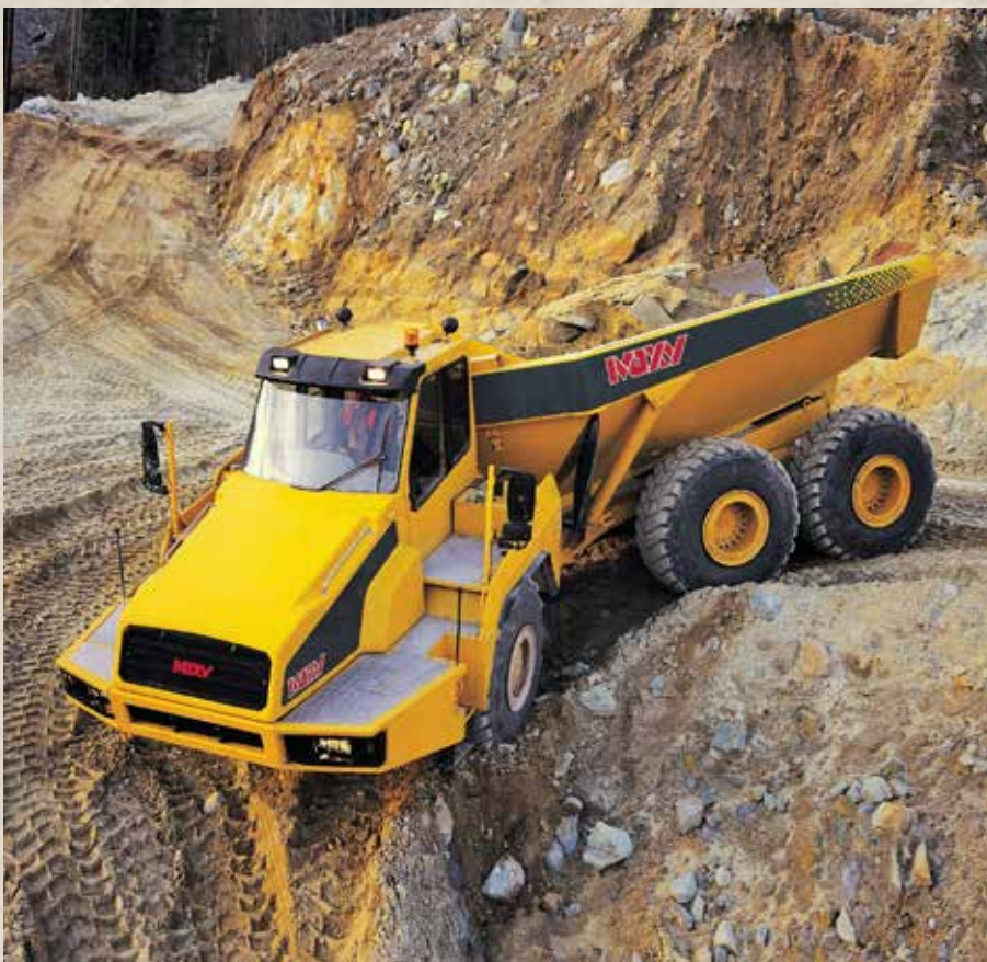
Eneleverandør: Duun produserte førerhus til Moxy i perioden 1985-2002.

I 1997 inngikk FK en partneravtale med DeLaval, der svenskene krevde eksklusivitet for egne gjødselpumper. Begivenheten var dramatisk for Duun. A-K maskiner hadde konkurrert med FK om å vinne avtalen med DeLaval. Duun henvendte seg til A-K maskiner, for å finne en ny distributør av gjødselprogrammet. Og til lettelse for Duun, viste det seg at