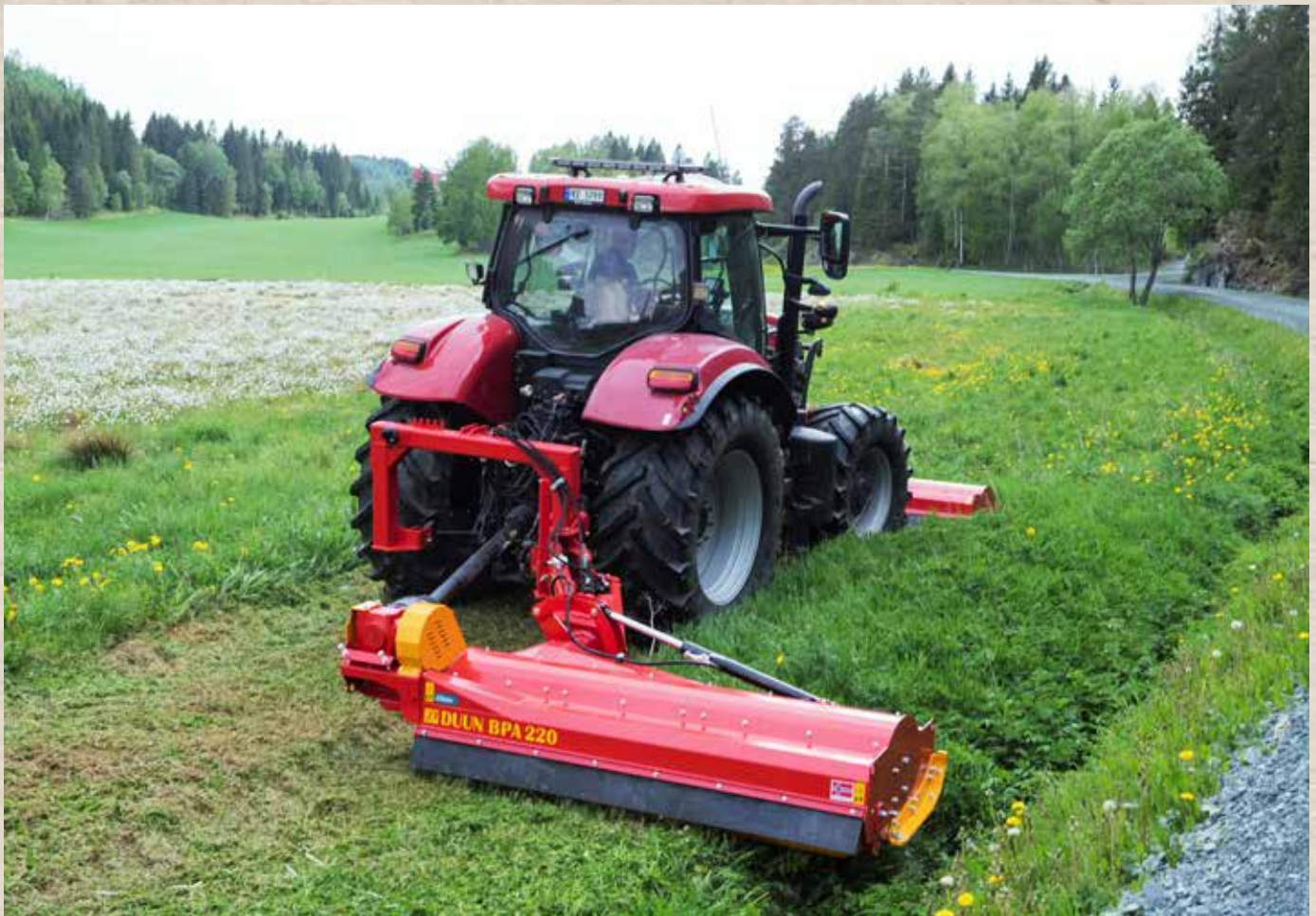
Mangesidig: Duuns produktprogram er delt inn i flere markedsområder. Bedriften er landets eneste produsent av beitepussere for landbrukstraktorer.