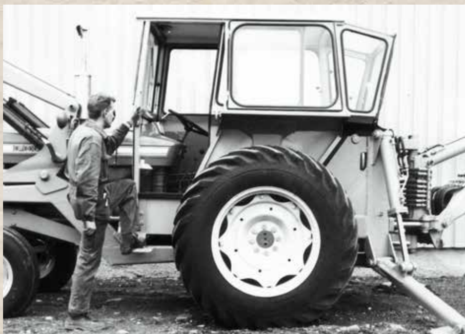
Med skyvedører: Duun D500 for anlegg og skog.

I 1985 gikk bedriften inn i en gullkantet avtale med Moxy-fabrikken i Romsdal, som gjorde Duun til eneleverandør av førerhytter til bedriftens midjestyrtedumpere. Inntil da hadde Moxy produsert hyttene selv. Avtalen fikk veldig stor betydning i siste halvdel av 1980-årene, inntil storkunden ble slått konkurs i oktober 1990. Hendelsen var dramatisk for Duun som underleverandør, fordi ►