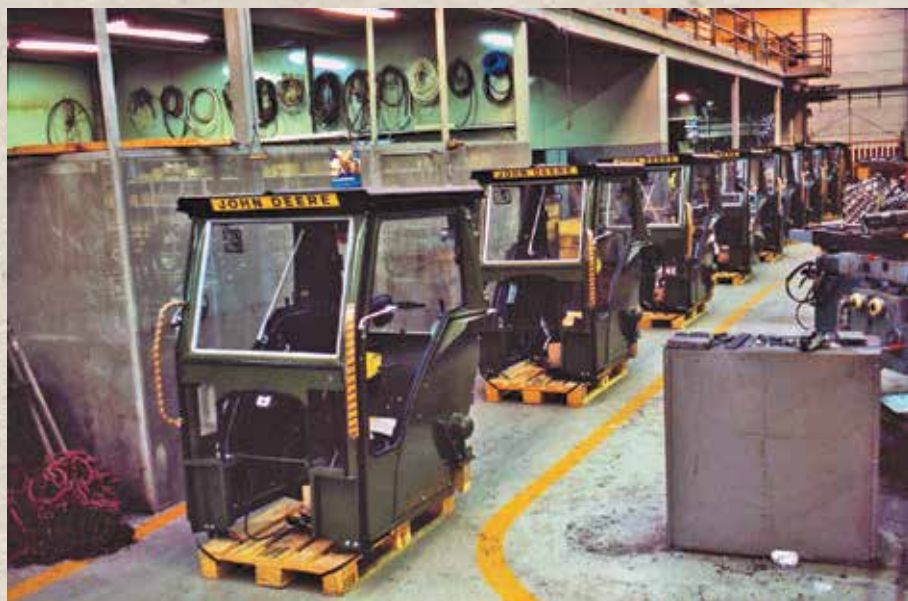
Ferdigstilt i serier: Duun Cabin ble produsert for John Deere, International og Zetor.

I løpet av 1970-årene kom en utvikling der mange traktormodeller ble levert med originale komforthytter eller med førerhytter fra blant annet danske Sekura. Duun raffinerte sin bøyle ved å lansere en lukket Duun Cabin, tilpasset John Deere, International og Zetor. Leveringsavtalene med norske distributører strakk seg fra 1976 og fram til 1981, men så var det også definitivt slutt. Duun Cabin hadde utspilt sin rolle. Færre førervern for traktor ble gjennom 1970-årene, delvis kompensert med utvikling av førerhytter for gaffeltrucker. Avtaler ble fortløpende inngått med importørene av Toyota, TCM, Mitsubishi og Linde. Den mest kuriøse delen av denne historien var rustfrie førerhytter, spesielt beregnet på korrosive forhold i fiskerinæringa. Det ble også produsert kranførerhus gjennom flere år.